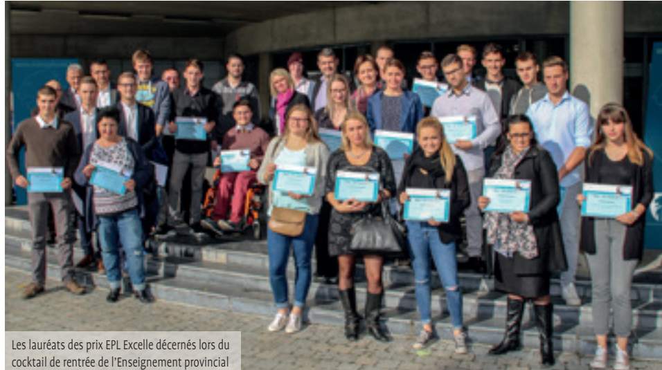
Les lauréats des prix EPL Excellente décernés lors du cocktail de rentrée de l'Enseignement provincial

Sujet « inévitable » pour le premier numéro de L'Échotier en cette nouvelle année scolaire, la rentrée des classes est bien entendue au cœur du dossier du trimestre. Au programme, un petit tour d'horizon (non exhaustif) d'activités qui ont émaillé ces dernières semaines.