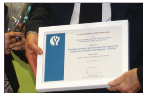
Cellule de Formation « API » récompensée. p9