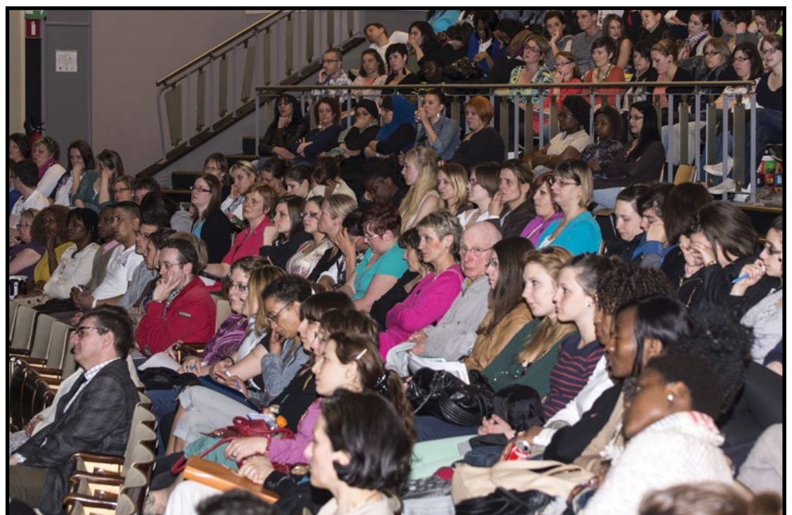
Colloque « Quel avenir pour les métiers de soins ? » organisé en collaboration avec l'ASBL « Les amis de Jean Boet » le 24 avril 2013 dans la salle des fêtes de la Haute Ecole de la Province de Liège