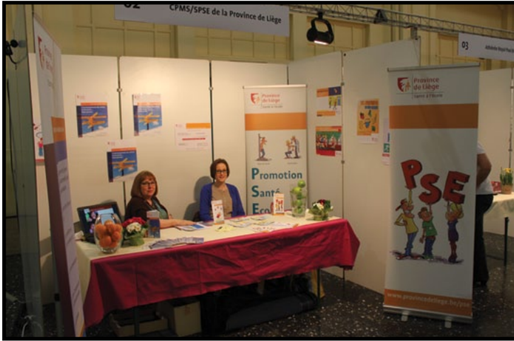
Stand CPMS/SPSE au « Salon de l'emploi et de la formation » consacré aux métiers de soins à l'Ecole Polytechnique de Seraing le 29 mars 2013