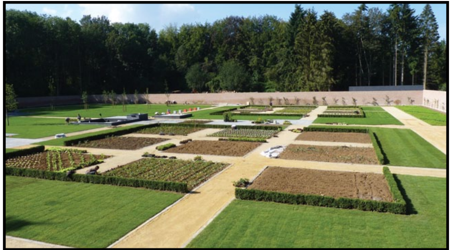
Le parc-potager du domaine

production mais va aussi donner aux élèves l'opportunité de suivre une production à grande échelle (15000 plants), ce qui constitue un plus indéniable dans leur apprentissage.