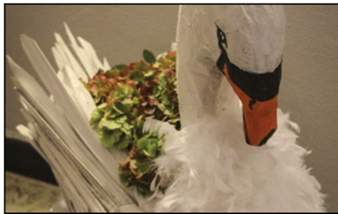
IPEPS de Huy-Waremme sous le cygne des fleurs. p.7