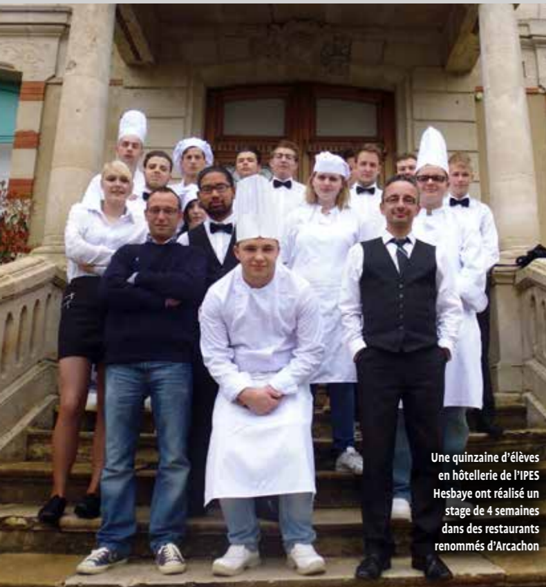
Une quinzaine d'élèves en hôtellerie de l'IPES Hesbaye ont réalisé un stage de 4 semaines dans des restaurants renommés d'Arcachon