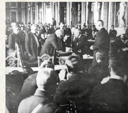
Unterzeichnung des Versailler Vertrags

Der Versailler Vertrag, der nach dem Ersten Weltkrieg zwischen den Alliierten und Deutschland geschlossen wurde, markiert das Ende des Übergangs vom alten Europa - einem Europa der multinationalen Reiche - zu einem Europa der Nationalstaaten. Das Selbstbestimmungsrecht der Völker, das Prinzip der Nationalstaaten, der Wunsch nach einer offenen und nicht mehr geheimen Diplomatie sind die Grundpfeiler bei der Ausarbeitung des Friedensvertrags. So soll eine neue europäische und internationale Ordnung entstehen, in Anlehnung an das 14-Punkte-Programm von US-Präsident Thomas Woodrow Wilson (Januar 1918), das später vom Völkerbund verwaltet wird.