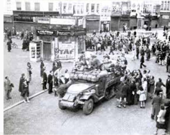
Lüttich, place Cathédrale

Liège retrouvait son enthousiasme des grands jours pour manifester sa joie!