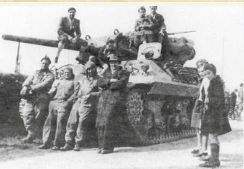
3. Bilder von der Durchfahrt der Task Force Lovelady während der Befreiung der Dörfer Plainevaux, Neuville-en-Condroz und Rotheux-Rimière