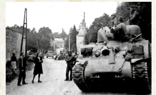
Harzé, Befreiung am 9. September

In den Tälern von Ourthe und Amel besetzen amerikanische Soldaten am 9. September die Brücke von Aywaille und errichten einen kleinen Brückenkopf. Ihnen gegenüber steht die deutsche Panzerdivision „Das Reich“, die zwischen Juni und August den Tod unzähliger französischer Zivilisten verschuldet hatte. Die Deutschen nutzen das Dorf Harzé und das dort gelegene Schloss als Zwischenstopp. Ein Großteil der Bevölkerung flieht aus dem Dorf. Als die Nacht hereinbricht, dringt die SS in die Häuser ein und nimmt 41 männliche Geiseln. Zehn von ihnen werden sofort exekutiert. Die ganze Nacht lang müssen die eingeschlossenen Geiseln den Außengeräuschen lauschen, Maschinengewehrschüssen und Artillerie-Feuern. Am frühen Morgen steigt Rauch zum Himmel auf. Die SS zieht sich zurück. Vorher jedoch entführt sie sieben junge Mädchen und postiert sie als lebende Schutzschilde auf den deutschen Fahrzeugen. Sollten die Widerstandskämpfer den Rückzug behindern, erschießen sie die Mädchen. Die Amerikaner jedoch rücken zum Knotenpunkt bei Werbomont vor. An der Schule wachen nur noch zwei junge SS-Männer über die Geiseln, die in einer Blitzaktion durch die Amerikaner befreit werden. Nachmittags wird gefeiert, denn das Schlimmste konnte verhindert werden.