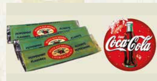
Kaugummi und Coca-Cola, mitgebracht von den Amerikanern