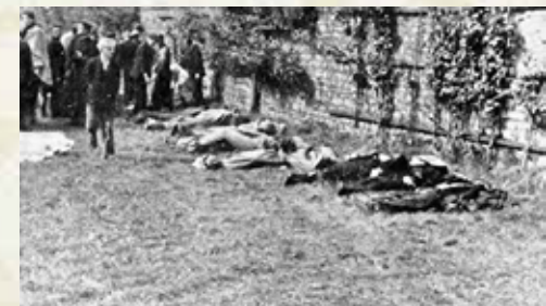
Forêt, nach dem Massaker

Am selben Tag, zwischen 9 und 15 Uhr, verübt eine Einheit der Wehrmacht auf dem Gebiet der Gemeinde Forêt (Trooz), nahe dem Château de Forêt und dem Bauernhof Labeye - ein besonders abscheuliches Kriegsverbrechen. Kämpfer der Résistance-Gruppierung „Armée Secrète“ - gegründet in London, mit Unterstützung der belgischen Regierung - die sich im Kampf ergeben hatten, werden ebenso wie Mitglieder des Roten Kreuzes ermordet. Nach dem Massaker