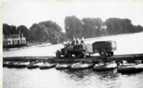
Lüttich, Pontonbrücke vor dem Jardin d'Acclimatation

Les deux rives de la Meuse étant libérées, l'armée américaine s'empresse alors d'établir un double pont de bateaux en face du parc de la Boverie. C'est ainsi que sont acheminés les approvisionnements nécessaires à la poursuite des opérations militaires en direction d'Aix-la-Chapelle.