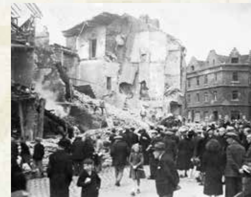
Lüttich, Massaker am Cadran

Am Morgen des 7. September befreien die Amerikaner Waremmes. Kurz vor Mittag erreicht ein Aufklärungsfahrzeug