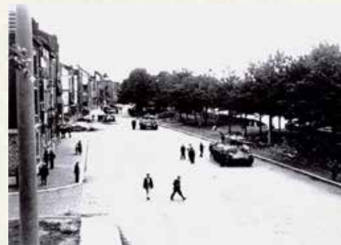
Lüttich, quai des Ardennes

Rue de Fétille/Rue des Vennes. Die amerikanische Panzerkolonne rückt vor, am Quai Mativa entlang hin zum Jardin d'Acclimatation.