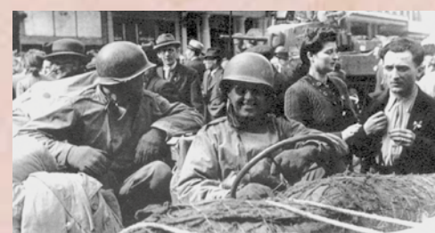
Place de la République française, Lüttich

6. September. Beim Anblick einer nicht identifizierten Panzerkolonne in der Gegend von Dinant ruft am Abend ein amerikanischer Kompanieführer aus: Entweder sind wir heute die glücklichsten Menschen in der US-Armee, oder wir gehen vor die Hunde. Und sie waren glücklich ... Eine zur Verstärkung geschickte Panzerkolonne hatte es geschafft, den Fluss weiter nördlich zu überqueren und die deutsche Verteidigung rasch zu zerschlagen. Am 7. September nimmt die Infanterie morgens Dinant ein und beginnt am Nachmittag ihren Vorstoß gen Osten