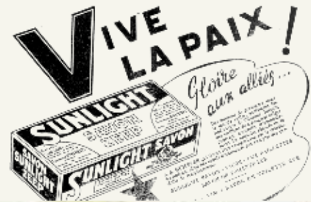
In der belgischen Presse veröffentlichte Werbung für die Produkte der Lever-Gruppe

Die freudigen Momente dieser Septembertage weichen jedoch bald den Sorgen ... Die Nahrungsmittelknappheit hält an. Die wirtschaftliche Situation ist nicht berauschend. Die Männer fehlen überall. Es herrscht politische Unsicherheit. Ein leidenschaftlich geprägtes Klima begleitet die Entnazifizierung. Nur drei Wochen nach der Befreiung der ersten belgischen Stadt kommt schon die Enttäuschung.