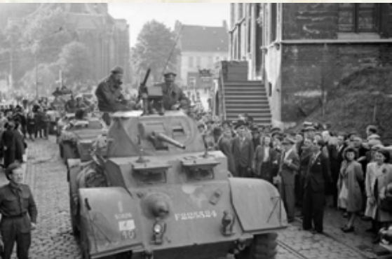
Ankunft der britischen Armee in Mons

Am Abend des 3. September. Die drei Divisionen des von General Collins geführten VII. US-Korps (1. US-Armee, General Hodges unterstellt) werden an einer Front von Mons bis in den Süden von Charleroi eingesetzt. General Collins erhält allgemeine Anweisungen für den weiteren Vorstoß nach Osten, über Lüttich und Aachen, und ordnet die Errichtung eines Brückenkopfes am rechten Maasufer bei Dinant an.