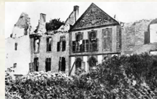
Forêt, Schloßruine nach der Tragödie

übergießen die deutschen Truppen die Leichen mit Benzin und zünden sie an, ebenso wie das Château de Forêt und den Bauernhof. Die Gesamtbilanz: 5 tote Kämpfer am 5. September, 33 am 6. September, 13 Tote nach Kapitulation, 65 Gefangene (23 davon sterben beim Gemetzel auf der Staumauer der Île Monsin, weitere während der Deportation) - insgesamt mindestens 74 Tote.