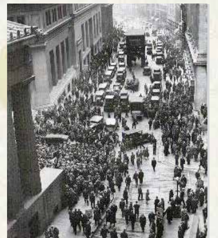
Nach dem Crash: drängende Menschenmenge vor der New Yorker Börse

Zunehmende internationale Spannungen schaffen Raum für neue bilaterale Beziehungen, die defensiv sein sollen, die aber die Kluft zwischen Gewinnern und Verlierern der Friedensverträge erst recht deutlich machen. Die Demokratien sind in Bedrängnis.