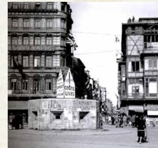
Lüttich, Blockhaus, Rue Pont d'Avroy

In der Folge der Panzerschlacht von Rocourt erreichen die Amerikaner Sainte-Marguerite, wo sie erfahren, dass die Deutschen mit Sprengstoff beladene Panzer in die Luft sprengen, um ihr Vordringen zu verzögern. Drei kleine ferngesteuerte Panzer werden jeweils an einen der drei Hauptknotenpunkte des Stadtteils entsandt.