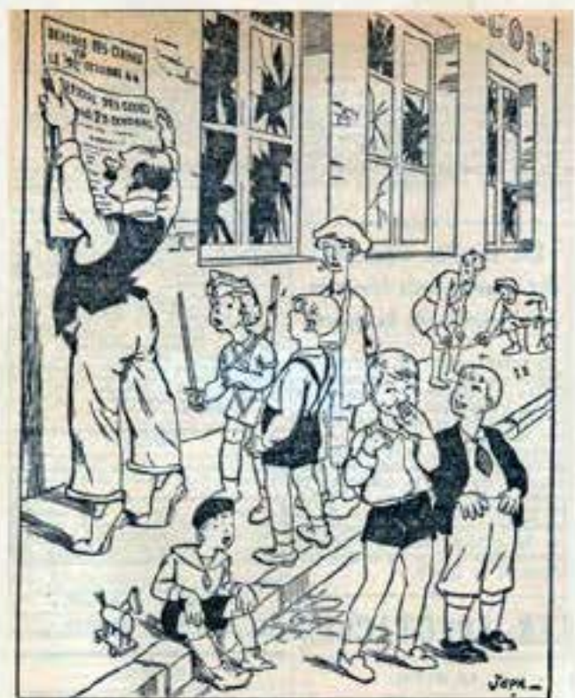
Nous reviendrons ce soir pour causer les derniers carreaux.

C'est une guerre psychologique aussi car la caricature donne une certaine image, souvent méchante et violente ; elle influence les comportements et les sentiments. L'humour peut être noir, ironique et surtout très mal intentionné. L'image est un puissant relais de l'écrit pour diffuser une idée auprès de l'opinion publique.