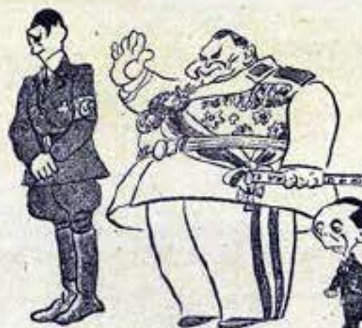
LE TYPE ARYEN Un homme blond comme Hitler, mince comme Goering, grand comme Goebbels.

Durant l'occupation, l'expression graphique prend des formes multiples et inattendues. Elle est partout. Plus qu'un simple aspect anecdotique, elle en devient un enjeu stratégique. Tracts, journaux clandestins, affiches se multiplient ; la représentation figurée est au cœur de la propagande.