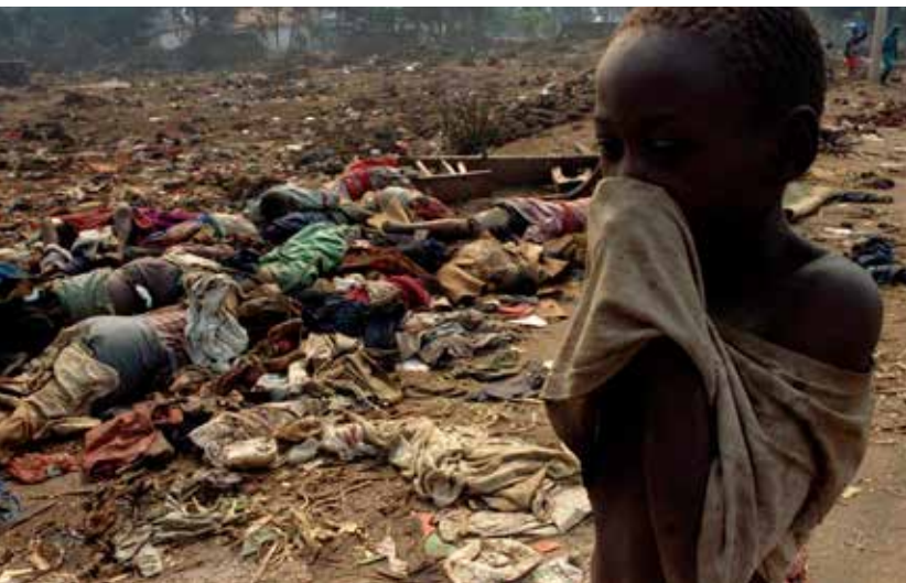
Rwanda, Massaker an den Tutsi, 1994

ähnlicher Weise dehnt das Konzept des totalen Krieges (siehe Kriegsblatt Nr. 2, S. 5) die Gefahren des Kampfes auf die Zivilbevölkerung aus und macht sie zu „legitimen“ Zielen. Mit dem Aufkommen der totalitären Regime der Zwischenkriegszeit erreichen diese Hass-Lehren die Spitze des Staates und werden zu Regierungsideologien. Völkermord wird in den Grundsätzen des Staates verankert.