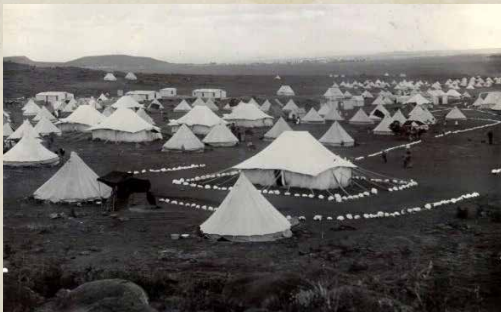
Bloemfontein, Zelte eines Internierungslagers (manchmal von der britischen Verwaltung auch Konzentrationslager genannt) zur Kontrolle der Familien der Burenkrieger

Es ist ebenfalls zu bemerken, dass die ersten Lager nicht für Juden bestimmt waren. Diese werden als Untermenschen bezeichnet und sind die Rehabilitation nicht wert... Selbst kriminelle Deutsche durften nicht durch den Kontakt mit Juden beschmutzt werden. Man durfte irreführte und reformgesinnte Deutsche nicht mit Juden vermischen, die ja so weit vom Arier entfernt waren, wie das Tier vom Menschen.