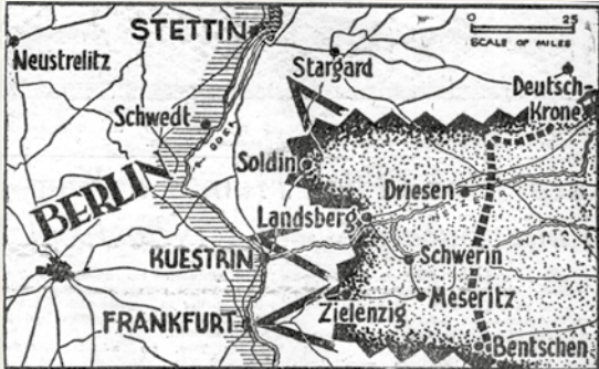
Stars and Stripes Map by Brown Striking west from solid front (shaded area) in eastern Germany, Soviet spearhead was reported 35 miles from Berlin at Oder River above Kuestrin. Two other Russian thrusts to Frankfurt and Stettin reached Oder, where, Germans were believed to have defense line.

Die sowjetische Speerspitze, die von einer festen Front (shaded area) in Ostdeutschland westwärts einschlug, wurde 35 Meilen von Berlin an der Oder oberhalb von Kuestrin gemeldet. Zwei weitere russische Vorstöße in Richtung Frankfurt und Stettin erreichten die Oder, trotz der Verteidigungslinie, die die Deutschen dort zu haben glaubten