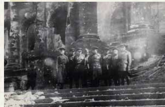
Kommandanten des 8. Panzerkorps der Garde in Berlin vor dem Reichstag

Die Kapitulation der deutschen Streitkräfte in Italien und die Schlacht von Berlin sind zwei prägende Ereignisse am Ende des Hitlerregimes. Nach der Hinrichtung Mussolinis und dem Selbstmord Hitlers brechen die faschistischen und nationalsozialistischen Regime, die sich mit ihren Schöpfern identifizierten, zusammen und verschwinden. Am Abend des 30. April 1945 um 22 Uhr weht die sowjetische Flagge über dem Reichstag. Sie ist Zeichen für das Ende des Krieges in Europa – und für den Beginn des Kalten Krieges.