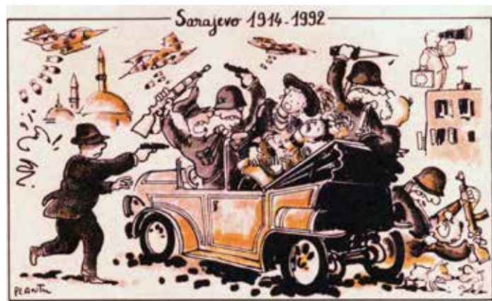
Zeichnung von Plantu, „Quelle connerie la guerre!“, Paris 2016, S. 154