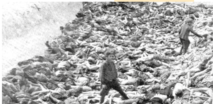
Bergen-Belsen, SS-Sanitätsoffizier inmitten von Leichen