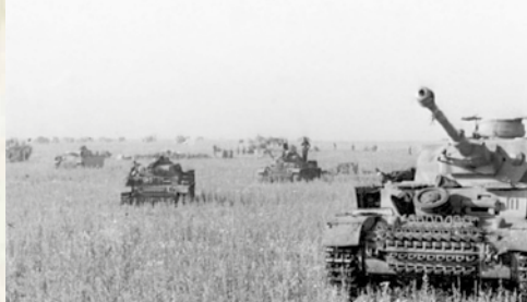
21. Juni 1943: Konzentration von Panzer IV in den Ebenen vor der Ausbuchtung von Kursk

Vor Stalingrad, an der Wolga, kommt die deutsche Offensive jedoch zum Stillstand. Nach einem erbitterten Kampf ergeben sich die Deutschen in den ersten Februartagen 1943. Eine Armee von 330.000 Mann wird unnötig geopfert, obwohl Stalingrad gar kein vorrangiges Ziel ist. Vor allem die psychologischen und politischen Folgen dieser ersten großen deutschen Niederlage sollen sich als unkalkulierbar erweisen; für die ganze Welt ist dies das Ende des Mythos der deutschen Unbesiegbarkeit. Trotz des Verlustes von 1.500.000 Soldaten im bisherigen Russlandfeldzug nehmen die deutschen Armeen den Angriff an der Ausbuchtung von Kursk wieder auf, wo vom 5. Juli bis zum 23. August 1943 die größte Panzerschlacht des Zweiten Weltkriegs stattfindet. Auch dort führt der heftige Widerstand der Sowjets, gefolgt von ei-