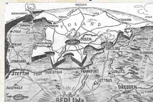
Alle Wege führen nach Berlin

Die Entwicklung der aktiveren Auffassung von Propaganda hängt mit dem historischen Aufkommen der Massen in der politischen Landschaft zusammen, sowohl in Europa und Amerika (das Beispiel Stars and Stripes ) als auch auf Weltebene. Der Zweite Weltkrieg internationalisierte den Kampf der Waffen und Ideen.