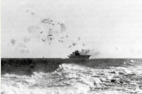
24. August 1942: Luftangriff auf den Flugzeugträger Enterprise während der Schlacht bei den Ost-Salomonen

Ab 1943 gewinnen die amerikanischen Streitkräfte definitiv die Oberhand. Die amerikanische Rüstungsproduktion ist damals in vollem Gange, insbesondere durch die Lieferung neuer schwerer Flugzeugträger, die zur entscheidenden Waffe im Pazifikkrieg werden. Parallel dazu wird die Strategie des Leapfrogging (wörtl. „Froschhüpfen“) entwickelt, bei der die Marines nicht jede Insel zurückerobern müssen, sondern eine Insel in einem Archipel einnehmen und zu einer soliden Basis machen, bevor sie einen neuen Sprung in Richtung Japan machen. Die Salomon-Inseln, die Marshall-Inseln, die Marianen, die Carolinen, dann die Philippinen und schließlich der japanische Archipel selbst sind Beispiele für diese Taktik.