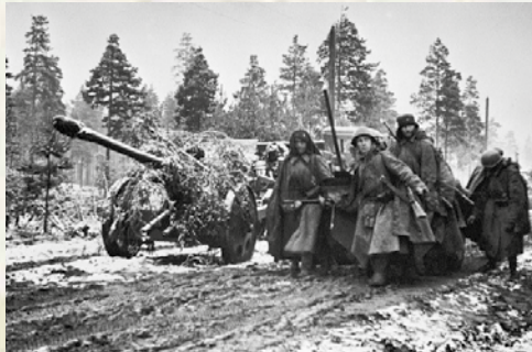
1. November 1941: Sowjetsoldaten an der Leningrader Front

Armeen, die nun direkt von Hitler befehligt werden (der immer weniger im Einvernehmen mit seinen Generälen steht), die Offensive am Don wieder auf, um die sowjetische Armee von ihren alliierten Nachschublieferungen abzuschneiden. Die Offensive ist zunächst erfolgreich: Die Deutschen erreichen den Kaukasus, sind aber nicht in der Lage, die Kontrolle über die strategische Erdölzone von Baku zu übernehmen.