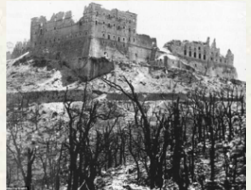
Mai 1944: Schlacht um Monte Cassino

Tag zur heimlichen Kapitulation der italienischen Armee. Unter dem Kommando von Generalfeldmarschall Kesserling neutralisieren die Deutschen augenblicklich die italienischen Streitkräfte und übernehmen selbst die Verteidigung der Halbinsel. Ein langer Verzögerungskrieg dauert den ganzen Winter 1943-1944 an und erreicht von Januar bis Mai 1944 auf dem Monte Cassino seinen Höhepunkt. Die Amerikaner marschieren am 4. Juni 1944 in Rom ein. Doch Norditalien, und insbesondere die Po-Ebene, bleiben bis zum Frühjahr 1945 in deutscher Hand.