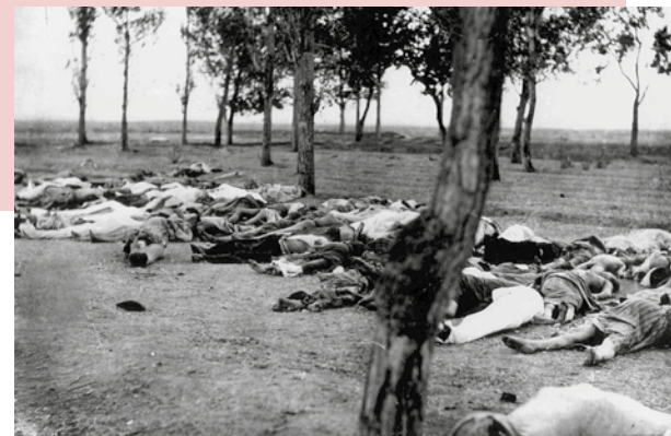
Ankara, Massaker an den Armeniern, 1915

Wenn auch Massaker eine alte historische Realität sind, gehören Völkermorde aufgrund der zentralen Rolle des Staates der heutigen Zeit an. Der Erste Weltkrieg hat die Gesellschaften mit dem Massensterben vertraut gemacht und damit die menschliche Existenz desakralisiert. In