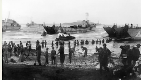
10. Juli 1943: Britische Soldaten bei der Landung in Sizilien

vember 1942 in Marokko und Algerien (Operation Torch) unter dem Kommando von General Eisenhower. Die Italiener und das Afrikakorps werden in die Zange genommen. Tunesien wird im April 1943 besetzt. Tunis wird am 7. Mai eingenommen, und am 12. Mai ergeben sich die Truppen der Achsenmächte am Kap Bon und lassen 280.000 Gefangene zurück.