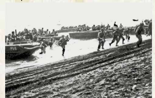
Marines landen am 7. August 1942 mit LCP-Landungsbooten auf den Stränden von Guadalcanal

Im Frühjahr 1942 hat Japan die Kontrolle über ganz Südostasien und einen großen Teil des Pazifischen Ozeans. Zwei große Schlachten setzen den japanischen Erfolgen ein jähes Ende: die Schlacht im Korallenmeer im Mai und die entscheidende Schlacht von Midway im Juni. Ab August 1942 beginnen die Amerikaner unter dem Kommando von General Mac Arthur erbittert um die Rückeroberung der Insel Guadalcanal zu kämpfen.