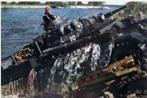
22. Juni 1941: Überqueren der deutsch-sowjetischen Demarkationslinie, die das Reich von der UdSSR trennte