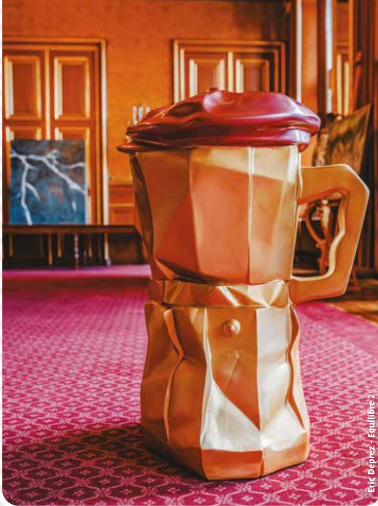
Eric Deprez - Equilibre 2