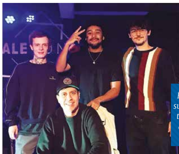
COACHING KAER X ONHA