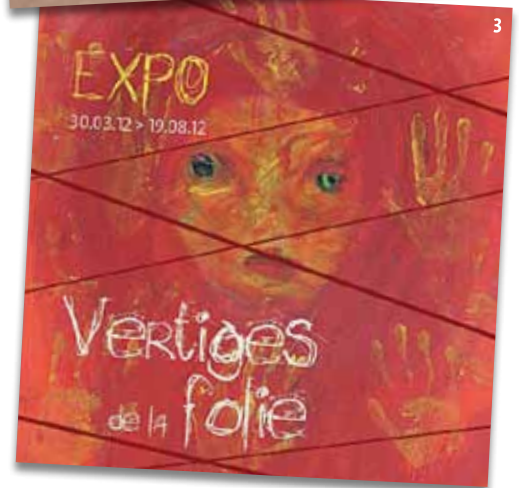
1. Cornelis van Haerlem, Portrait van een nar met gele zotskap , 1500, TIN Museum, Amsterdam. • 2. Jephah de Villiers, Les Arches du silence II . • 3. Anouchka D'Anna, Les mains de l'Abîme .

Jusqu'au 19 août 2012, au Musée de la Vie wallonne, une exposition qui ne manquera pas de vous donner le vertige ! ■