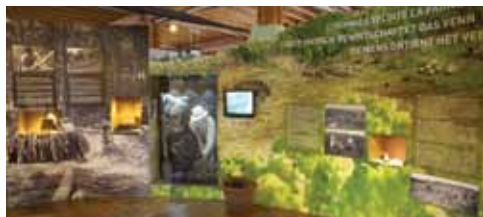
Découvrez les vieux métiers fagnards.

Originale, informative, interactive et ludique, elle vous transportera dans les superbes paysages du Haut Plateau Fagnard.