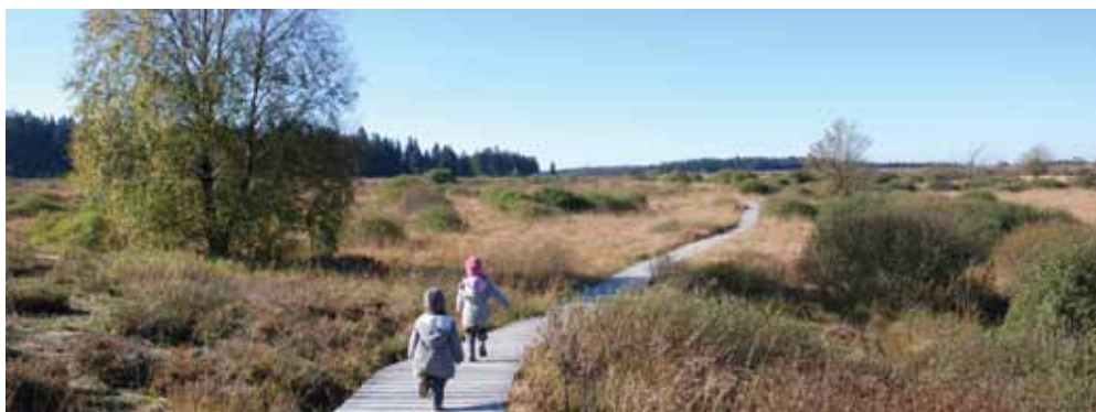
Promenez-vous à pied dans le plus vaste parc naturel de Wallonie.

Il n'est pas toujours nécessaire de partir loin pour découvrir de magnifiques paysages. Chez nous aussi, les patrimoines naturel et culturel regorgent de trésors qui ne demandent qu'à être découverts. Et c'est bien de découverte dont il est question avec la nouvelle exposition permanente Fania. Fania, c'est l'aboutissement de la transformation totale du musée de la Maison du Parc Naturel Hautes-Fagnes-Eifel. Et la concrétisation d'un projet transfrontalier de développement touristique dans la région de l'Eifel.