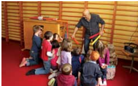
la formation proposée par le Service Jeunesse a pour objectif de permettre aux futurs animateurs d'acquérir les compétences nécessaires à la gestion d'activités d'animation de jeunesse (3-15 ans)

Service Jeunesse de la Province de Liège Rue Belvaux, 123 à 4030 Grivegnée - 04/237.28.93 isabelle.thomane@provincedeliege.be