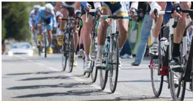
Tours de la Province de Liège et de Wallonie en juillet.

Infos : Tour de la Province de Liège : www.ucseraing.be Tour de Wallonie : www.trwworg.be