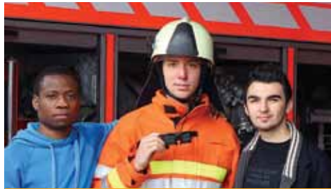
Nos jeunes étudiants ont voulu agir en mettant en pratique leur enseignement.

objectif, ils ont pu obtenir le parrainage de la société Néomytic et développer leur projet dans le cadre de leur stage de fin d'études auprès de la société NRB. Le département Recherche et Développement de l'Intercommunale d'Incendie de Liège et Environs leur a permis de confronter leur système de « traçage informatique » en conditions réelles de feu, à savoir dans un environnement chaud et enfumé.