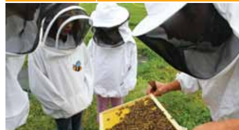
Un rucher didactique est installé au Domaine provincial de Wégimont. Des cours d'apiculture y sont proposés.