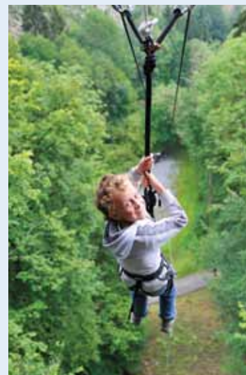
8 euros pour deux descentes du 14 juillet au 18 août.

Infos : www.palogne.be info@palogne.be • Tél : 086/21 24 12