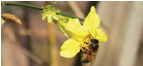
En visitant les fleurs, l'abeille permet la reproduction de plus de 80 espèces végétales !

L'abeille est source de vie. Malheureusement elle disparaît ! Aidez la Province à réagir ! Des graines de plantes mellifères sont à votre disposition dans nos Antennes d'Information à Eupen, Huy, Verviers et Waremme.