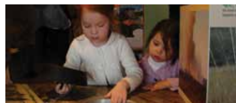
Apprendre tout en s'amusant et de façon ludique.

respectueux de l'environnement, vous parcourez le domaine en char à bancs, vélos électriques, trottinettes tout-terrain ou tout simplement à pieds. Une plaine de jeux originale sur le thème de la faune et des fleurs locales fera le bonheur des plus petits tandis que le jardin de plantes médicinales suscitera la curiosité des plus grands. Et après cette longue journée de découverte et ce bon bol d'air, il ne vous restera plus qu'à profiter d'une petite pause à la brasserie ou de faire un petit passage à la boutique verte. ■