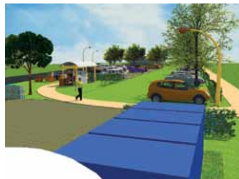
54 sites ont été analysés à proximité de grands axes routiers, de lignes de bus ou de train.