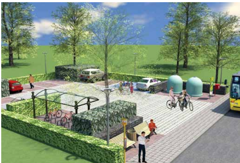
En plus des villes et des communes, de nombreux partenaires et acteurs de terrain ont été intégrés à la conception des parkings d'EcoVoiturage.