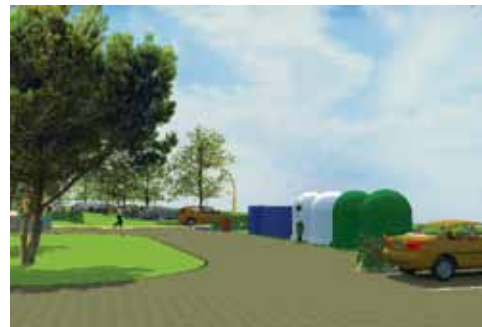
Cette nouvelle génération d'aires de stationnements proposera également plusieurs services tels que des bornes pour le rechargement de véhicules électriques, des bulles à verres, des abris pour vélos et motos, des tables et des bancs composant un coin détente.

existants déjà dans les vallées de l'Ourthe et de l'Ambrière; EDF Luminus qui a apporté son expertise précieuse concernant l'éclairage des lieux ou l'installation de bornes de rechargement de véhicules électriques.