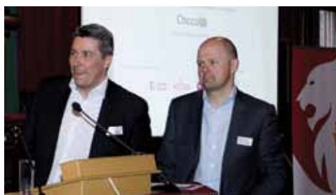
Des messages courts écrits sur des pralines, c'est le concept « Choc@ ».

Le Coup de cœur du jury a été attribué à un 2 e événement, les Specials Olympics 2012, qui se sont vu attribuer une mention spéciale. ■