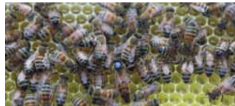
Malgré les efforts des apiculteurs, l'abeille continue à disparaître.

Pour les particuliers, des cours d'apiculture sont aussi assurés par la Fédération. Ces formations se donnent le samedi. Plus d'infos et inscriptions au 04/237.24.00 ou par mail : chateau.wegimont@provincedeliege.be