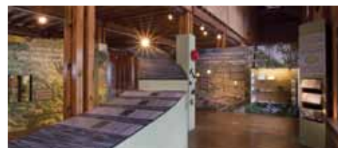
Découvrez la géologie du Plateau Fagnard.

Le Parc Naturel est là pour vous faire découvrir les Hautes-Fagnes, ses paysages, son histoire et sa culture. Par le biais d'un tourisme lent, durable et