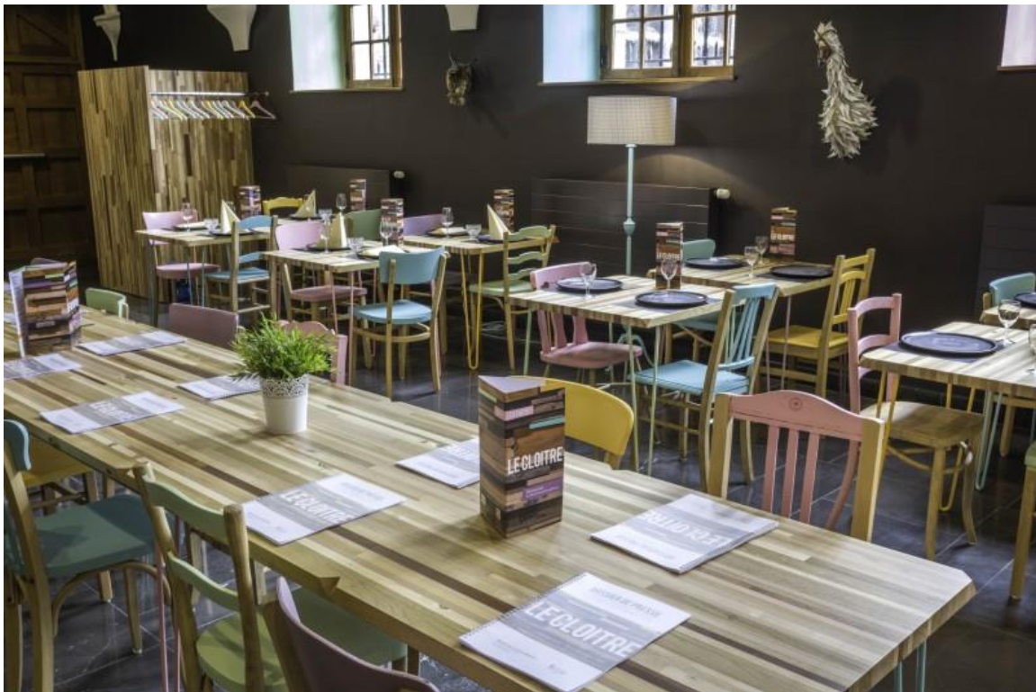
Restaurant « Le Cloître » au Musée de la Vie wallonne

Le Musée de la Vie wallonne offre aussi une riche programmation culturelle toute l'année.