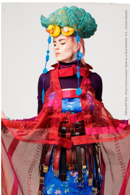
© VOYAGE AU TIBET, Défil'éco 2019, Photo Vincent Leonard, Make up La Rose Eclatante, D.A. Giovanni Biasiolo