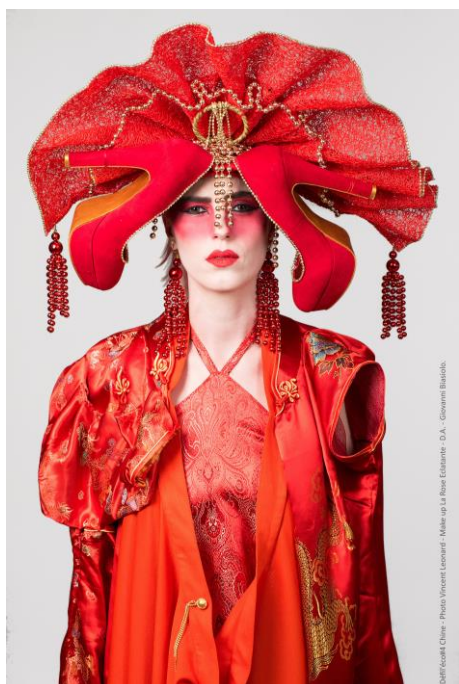
© LA DIVA, Défil'éco 2019, Photo Vincent Leonard, Make up La Rose Eclatante, D.A. Giovanni Biasiolo