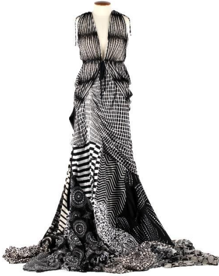
© BLACK'N WHITE OPTICAL, Maison HauteCouture , Giovanni Biasiolo, Coll. Musée de la Vie wallonne, 2018