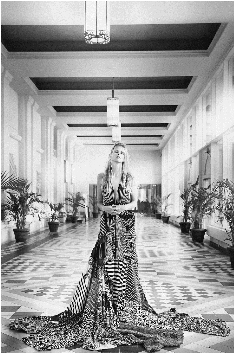
© BLACK'N WHITE OPTICAL, Maison HauteCouture , Giovanni Biasiolo, Photo Leslie Szmigielski, Coll. Musée de la Vie wallonne, 2018