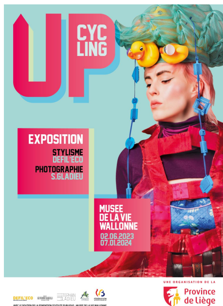
Voyage au Tibet Affiche de l'exposition