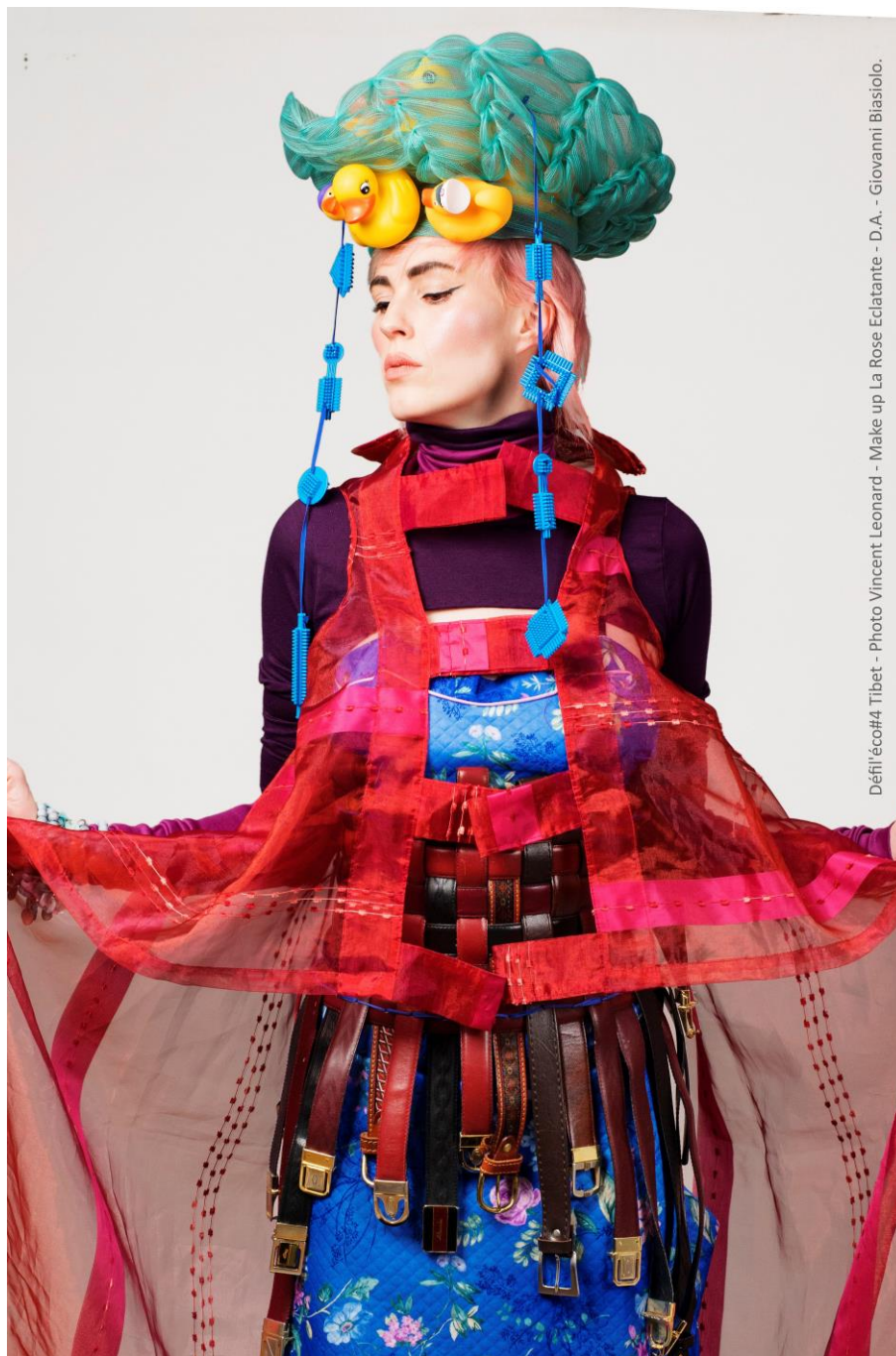
Défil'éco#4 Tibet - Photo Vincent Leonard - Make up La Rose Eclatante - D.A. - Giovanni Biasiolo.

© VOYAGE AU TIBET, Havre-SAC, Gams Belgique et EESSCFV Mosaïque, Défil'éco 2019, Photo Vincent Leonard, Make up La Rose Eclatante, D.A. Giovanni Biasiolo