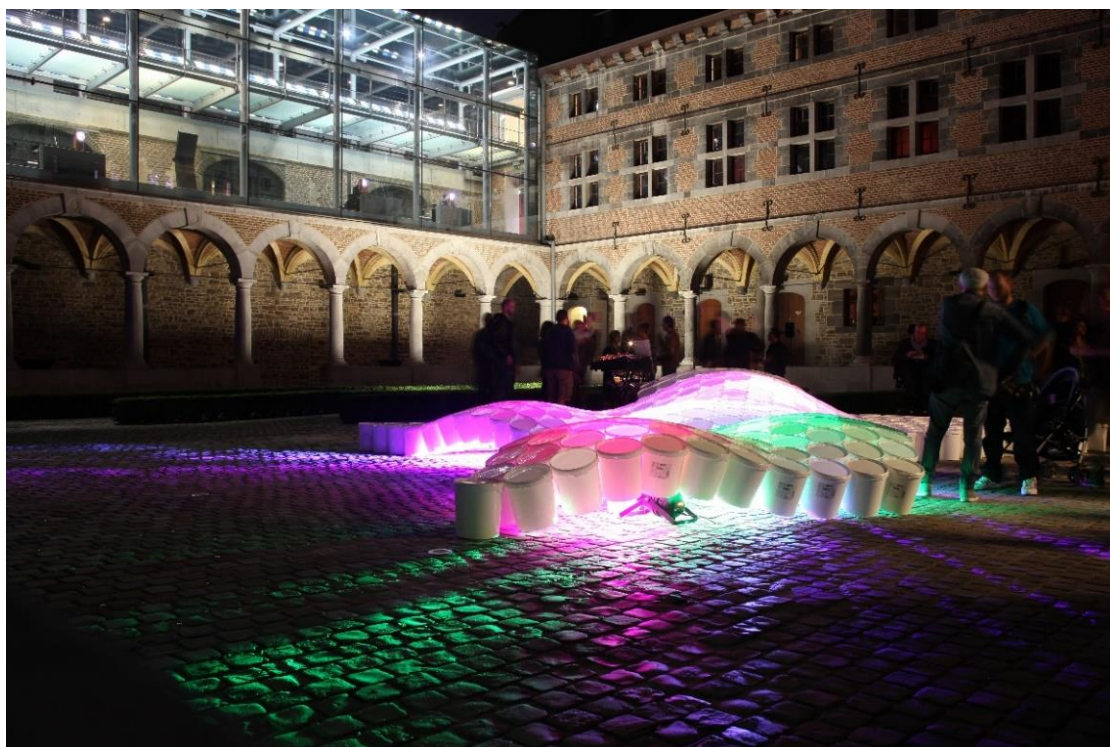
Nocturne des Coteaux de la Citadelle, FAB.W, 2014, Musée de la Vie wallonne

Le CENTRE DE DOCUMENTATION, situé dans la maison Chamart qui jouxte le Musée, se met au service des scientifiques autant que des chercheurs amateurs. L’institution muséale gère également le Fonds d’Histoire du Mouvement wallon et la Bibliothèque des Dialectes de Wallonie dont les archives sont accessibles sur demande au Centre de documentation.