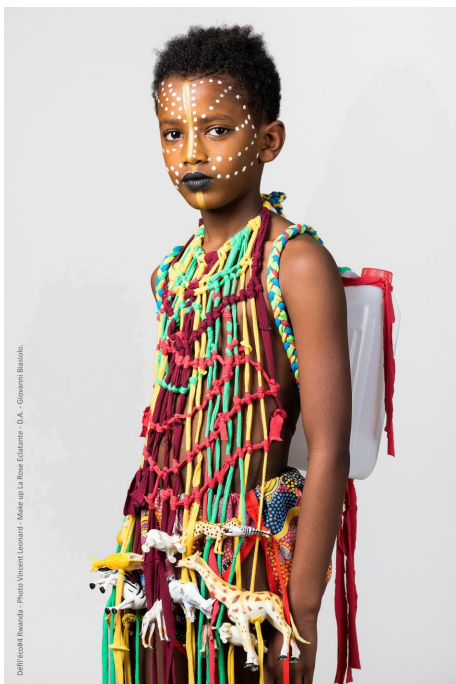
© VOYAGE AU RWANDA, Défil'éco 2019, Photo Vincent Leonard, Make up La Rose Eclatante, D.A. Giovanni Biasiolo