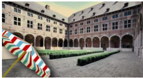
Cloître du Musée de la Vie wallonne Liège