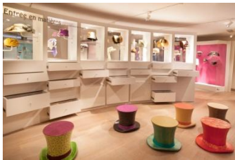
Une vie de chapeaux. Un chapeau pour chaque tête ?