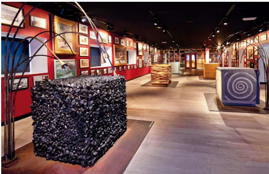
Wallonie(S), Espace « Découvertes », 2 e étage, Musée de la Vie wallonne

Les thématiques qui construisent le parcours de référence révèlent une Wallonie moderne, ouverte sur le monde en puisant dans ses racines.