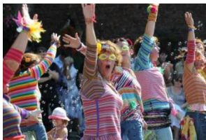
Les célèbres majorettes égarées