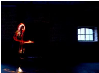
L'arène des ombres par OKUS LAB