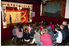
Théâtre de marionnettes