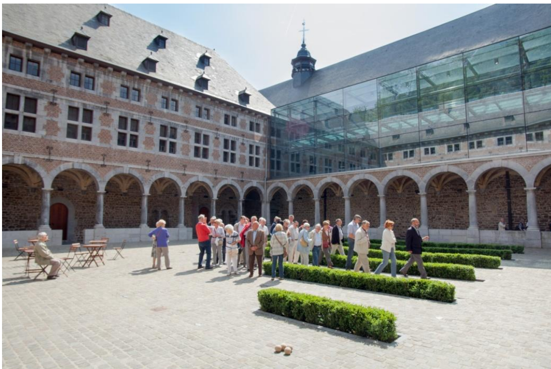
Cloître du Musée

Le Musée propose aussi une pause gourmande et agréable au centre ville, loin du bruit et de l'agitation. Géré par l'asbl Work'inn, l'ESPACE SAVEURS du Musée offre une carte composée de mets régionaux à prix très doux dans un cadre unique. Cet espace convivial est accessible à tous, sans visite du parcours muséal ou des expositions.