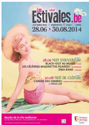
Visuel Les Estivales.be 2014