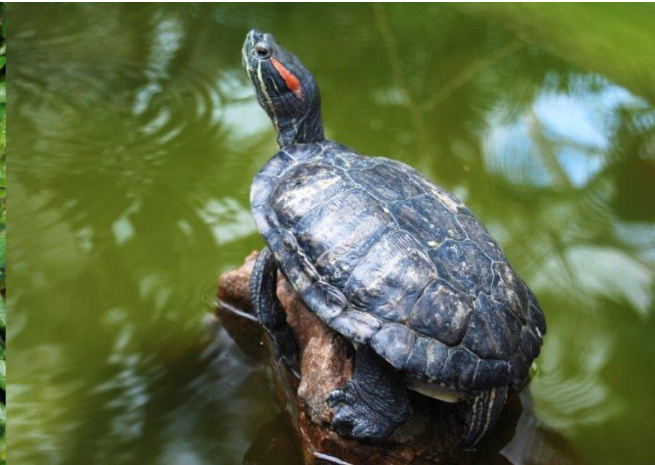
Tortue de Floride