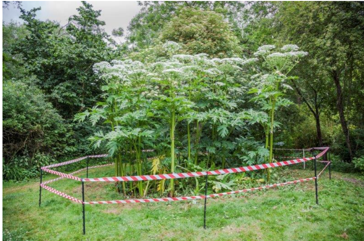
Berce du Caucase