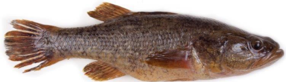
Goujon de l'amour