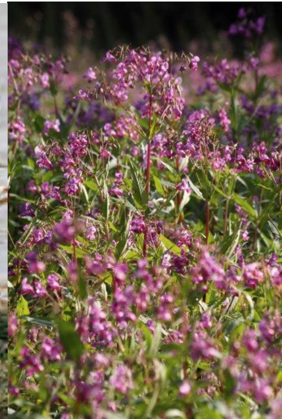
Balsamine de l'Himalaya